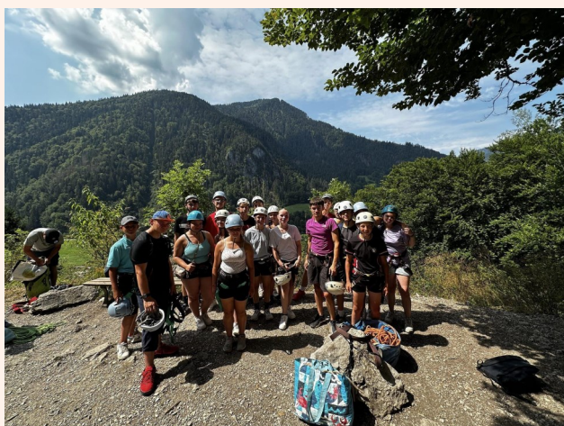
Séjour en Haute-Savoie